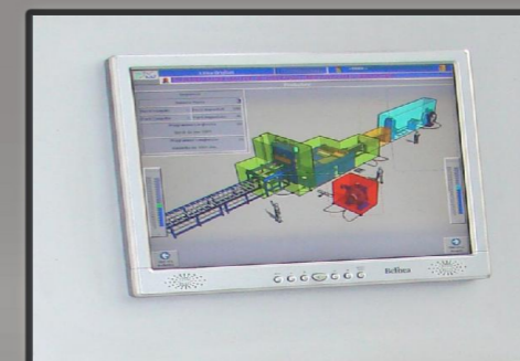
Pannello di controllo