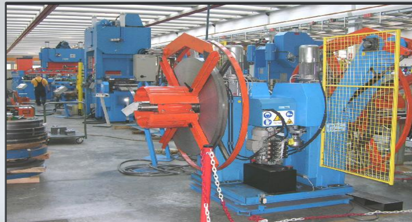
Vista di assieme macchina