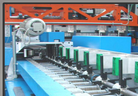
Unita' ribaltamento piatto portante