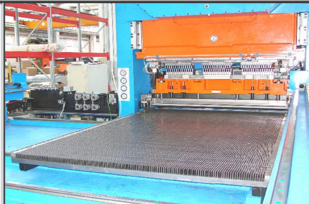
Vista in entrata pressa di assiematura