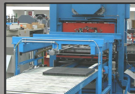
Vista in uscita pressa di assiematura