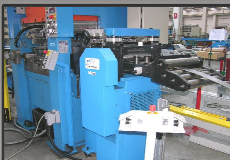
Raddrizzatrice alimentante e pressa